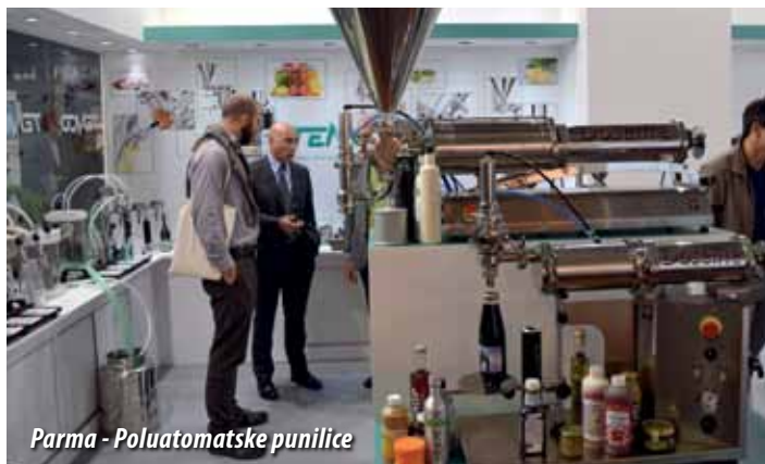
Parma - Poluatomske punilice

Drugi zanimljiv važan sajam se održao u Bolonji. Sajam EIMA je ogroman sajam i jedan je od najznačajnijih sajмова za poljoprivrednu i hortikulturnu mehanizaciju u zemlji. Bilo je preko 2000 izlagača. Dobra stvar je da je ulaz za strane državljane besplatan ako se unaprijed registrirate preko Interneta. Iako su garaže i parkirni svuda oko sajmišta kružili smo sat vremena ne bismo li našli parking. Čak jedan izlaz s autoceste vodi direktno u garažu, ali baš tu je i nemoguće bilo parkirati. Mnogo je lakše sa strane grada. Šetajući po sajmu i gledajući sve te ogromne traktore, kombajne shvatite kako naša poljoprivreda nema šanse proizvoditi po konkurentnim cijenama dok se ne okrupni i počne koristiti efikasnu mehanizaciju. Bilo je tu izloženo ponešto za svakoga. Nama najzanimljiviji strojevi su bili za skupljanje oraha i lješnjaka te strojevi za uništavanje korova i plijesni pomoću vatre za ekološke proizvodnje. Bili su još motori, strojevi za melioraciju i šumarstvo, traktori, motokultivatori, sva namjenska vozila i motorni priključci, strojevi za obradu, sjetve i gnojidbe, postrojenja i strojevi za obradu usjeva, strojevi za navodnjavanje, strojevi za berbu,