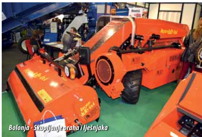
Bolonja - Skupljanje oraha i lješnjaka

strojevi za početnu obradu i očuvanje proizvoda, strojevi za stočarstvo, strojevi za agro-industrije, strojevi za transport proizvoda, dijelovi, pribor i rezervni dijelovi, oprema za vrtlarstvo i javne zelene površine, mali strojevi i ručno upravljani strojevi, razni strojevi za poljoprivredu, stočarstvo, strojevi i opreme za obnovljive izvore napajanja za poljoprivredu. Na oba sajma sam posjetio neke svo-