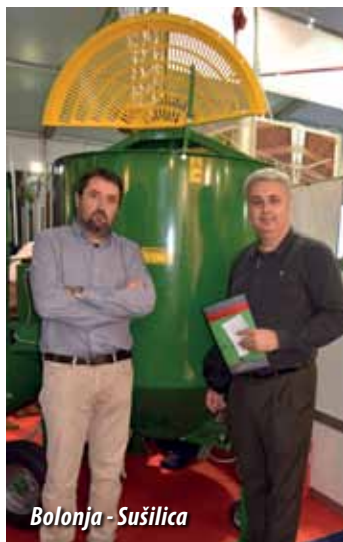
Bolonja - Sušilica

C ibus TEC i Food Packsu dva sajma održana su u Parmi u Italiji u glavnoj poljoprivrednoj regiji ove zemlje. Cibus Tec, sajam u prehrambenoj industriji, se održava već 70 godina, obogaćen je novim sajmom Food Pack, posvećenom najboljim tehnologijama za pakiranje prehrambenih proizvoda. Nakon posjete sajmu ostao sam iznenađen brojem i kvalitetom izlagača. Bilo je tu za svakoga ponešto. Predstavilo se samo iz Italije 750 izlagača, jako mnogo manjih proizvođača opreme, koji sebi ne mogu priuštiti izlaganja na najvećim svjetskim sajmovima. Još stotinjak ih je bilo iz cijeloga svijeta. Tim više je sajam zanimljiv za naše